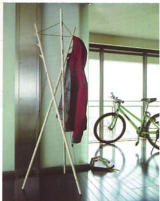
▲取名為Air的衣帽架以三根木條與尼龍繩，用最自然的方式在收納衣物的同時呈現無限的視覺空氣效應。