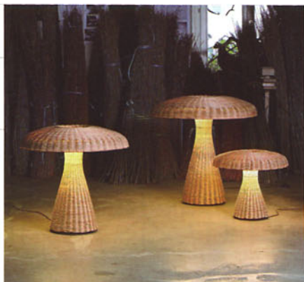
▲妮可與史帝芬受邀設計的Basso燈組，運用編織技巧，以乾燥過後的農作物為材料，為室內環境注入更多大自然氛圍！