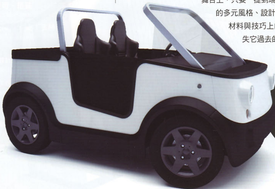
未來人類代步的環保 節能工具：E'mo。

A：與其他國家相比，瑞士在設計上擁有十分深厚的基礎與背景，長久以來瑞士設計總是與注重細節、能有效解決技術上問題，以及在材質用量上精準掌控……等特質畫上等號，但是在造型與給人的驚艷度上卻不太理想；然而這些印象卻在過去這十年間被一群新生代設計人給扭轉過來，所以在全球設計舞台上，只要一提到瑞士，大家就會忍不住開始討論它的多元風格、設計師令人驚喜連連的創意，以及在材料與技巧上的明智選擇，但同時，卻仍舊不失它過去的優良傳統！